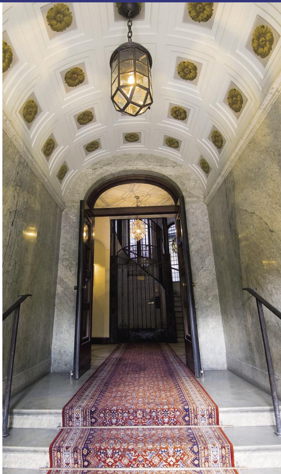
Entrén är fastighetens ansikte utåt.

Vi är inte för stora för de små, och inte för små för de stora!