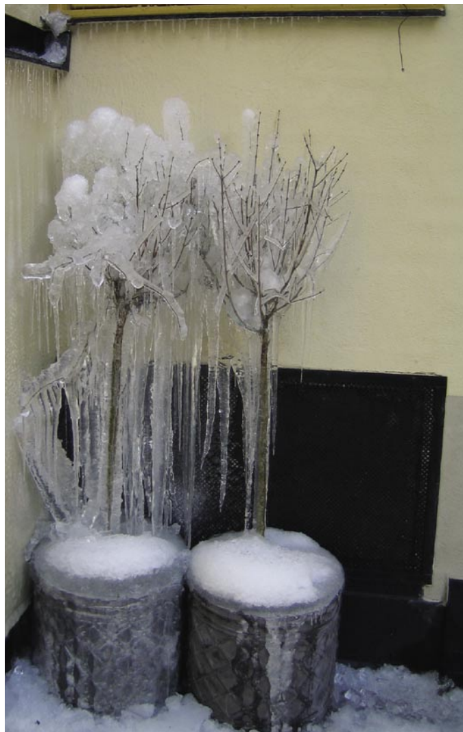
Att jobba förebyggande blir billigare i längden.